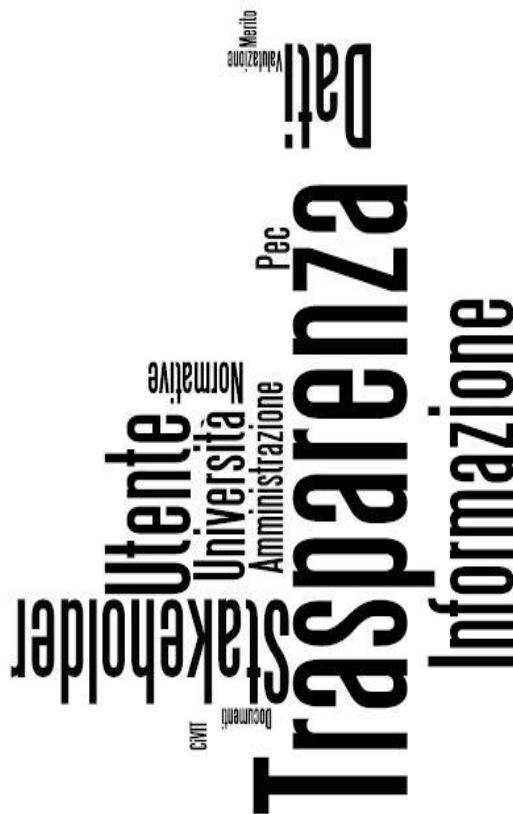
Figura 3: Infografica con Tag della Trasparenza

In sostanza è un modo alternativo di organizzare le conoscenze e renderle più immediate, come l'infografica in Figura 3 utilizzata nella locandina della Giornata della Trasparenza 2012 dell'Università degli Studi di Roma Tor Vergata.