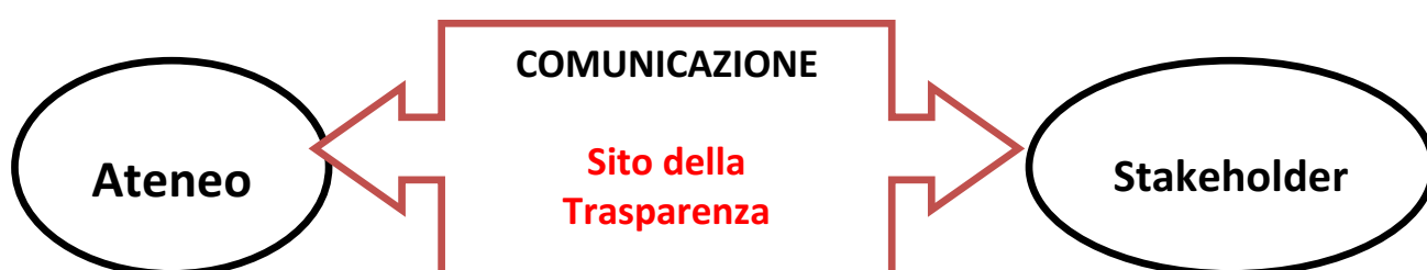
Figura 1. Flusso informativo bidirezionale con gli stakeholder

L'Università degli Studi di Roma "Tor Vergata" da sempre mostra particolare attenzione al tema della trasparenza e dell'integrità ritenendolo un fattore di miglioramento per l'efficacia dell'attività amministrativa così da potenziare il flusso informativo bidirezionale con gli stakeholder come descritto in Figura 1.