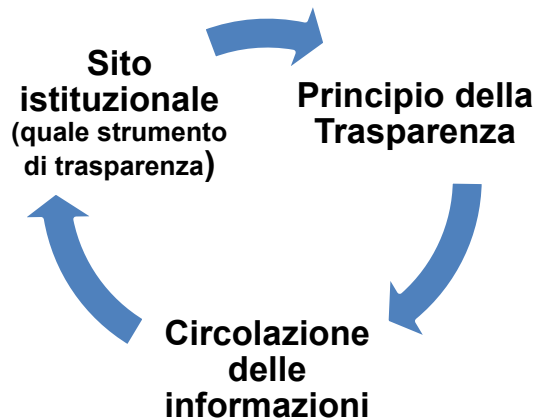
Figura 2: Ciclo delle informazioni